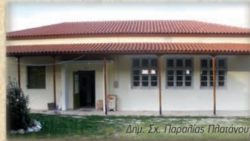
Δημ. Σχ. Παραλίας Πλατάνου

Το 1997 συγχωνεύεται το 1/θ δημοτικό σχολείο Αμπέλλου.