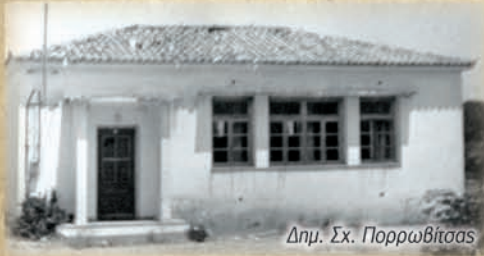
Δημ. Σχ. Πορρωβίτσας

Ο σύλλογος Διδασκόντων σε ειδική συνεδρίαση του στις 13-3-2008 πρότεινε στη θέση των απρόσωπων αριθμών, προσωνυμίες με ιστορική σημασία, όπως του Ανδρούτσου Σπανού, ιδρυτή του πρώτου δημοτικού σχολείου της Ανατολικής Αιγαίας, της σχολής της Ράχωβας το 1829, του Νικόλαου Σολιώτη, οπλαρχηγού στη μάχη της Ακράτας το 1823, του Νικόλαου Διαμαντόπουλου, ευεργέτη του σχολείου με επικρατέστερη την προσωνυμία «Κράθιο» δημοτικό σχολείο από τον ζωοδότη για όλη την περιοχή της Κραθίδας, Κράθιο ποταμό.