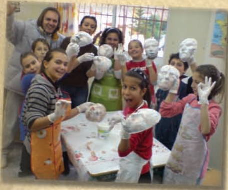
Μάσκες φτιάχνω από πηλό, για να παίξω Αριστοφάνη...

με το γυμναστή βοηθό πάει η γλώσσα μου ροδάνι