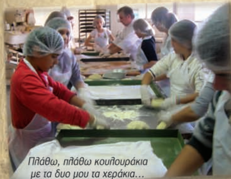
Πλάθω, πλάθω κουλουράκια με τα δυο μου τα χεράκια...