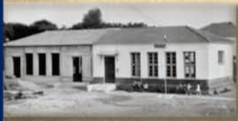
Μονοθέσιο ήταν στην αρχή, έκανε κι αδερφάκι κι έγινε διθέσιο αυτό το σχολειάκι» (1971), προσθήκη Β' αίθουσας.