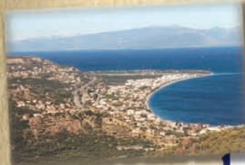
Μια θάλασσα δικιά μας φαίνεται από ψηλά, έχει γάργαρο νερό και ωραία αμμουδιά.