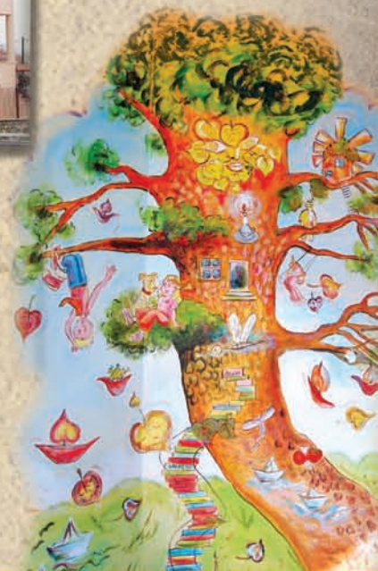
Τοιχογραφία σχολείου: Αναστασία Κασιάδη