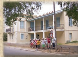
Οι μαθητές εξερευνούν το πρώτο σχολειό, που φοίτησαν παπούδες τους εκείνον τον καιρό.