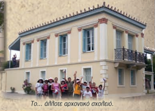
Το... άηλοτε αρχοντικό σχολειό.