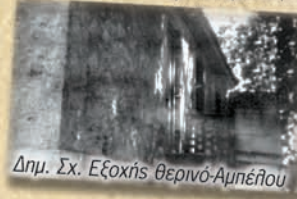
Δημ. Σχ. Εξοχής Θερινό-Αμπέλλου