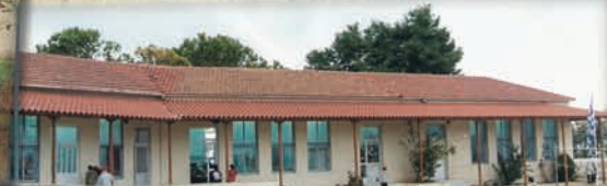
Το σχολειό έχει μεγαλώσει, μ' έξι τάξεις λειτουργεί και διδάσκει στα παιδιά γλώσσα κι αριθμητική. Μια μάντρα προφυλάσσει το παλιό μας το σχολειό, σύντομα όμως θα χαθεί... το καινούριο σαν χιουπέι.