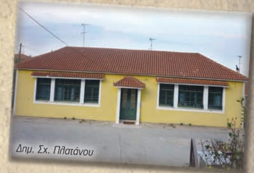
Δημ. Σχ. Πλατάνου

Τοποθετείται στο προαύλιο αίθουσα προκατασκευασμένη και λειτουργεί ως 6/θέσιο.