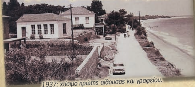
1937: χτίσιμο πρώτης αίθουσας και γραφείου.

Λεωφόρος Αιγαίου 14Α "Ο δρόμος είχε τη δική του ιστορία, χώρισε το σχολείο, από την παραλία"