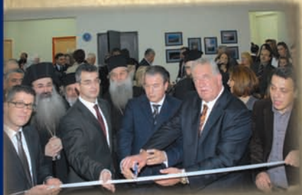
Η κορδέλα σαν κοπέι, γίνεται μια νέα αρχή.

Στης Κατοχής τα χρόνια, ήρθαν οι Ιταλοί... Διώξαν τους μαθητές, άδειασαν το σχολείο κι αμέσως το μετέτρεψαν σε πολυβολείο.