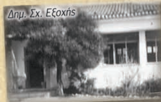
Δημ. Σχ. Εξοχής

Το 1989 με τη συνένωση των Κοινοτήτων της περιοχής στο Δήμο Ακράτας ονομάζεται 3 ο Δημοτικό Σχολείο Ακράτας.