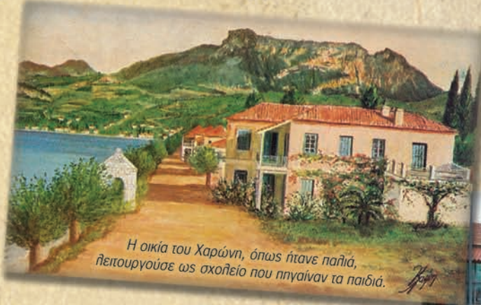
Η οικία του Χαράνη, όπως ήταν παλιά, λειτούργεσε ως σχολείο που πηγαίναν τα παιδιά.