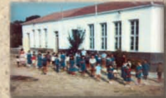
Οι μαθητές χαρούμενοι παίζουν στην αυλή κι οι δάσκαλοι μαζί τους γελούσανε πολύ.