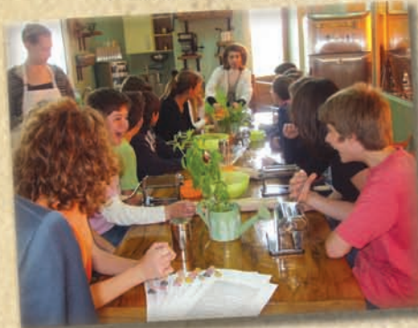
Στον Άγιο Στέφανο της Αττικής, πλάσαμε τα ζυμάρια στα Μυθέλια και πρόγραμμα της διατροφής "εμαγειρέψαμε" όλο γέλιο!!!

με το γυμναστή βοηθό πάει η γλώσσα μου ροδάνι