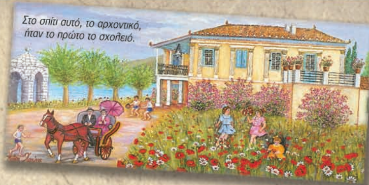
Στο σπίτι αυτό, το αρχοντικό, ήταν το πρώτο το σχολειό.