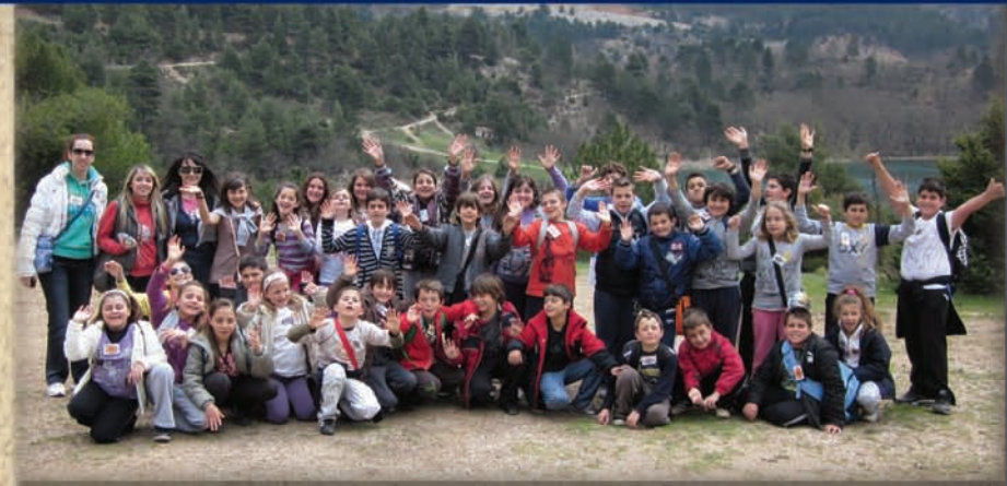
Πάνω στη λίμνη του Τσιβιθού στο ωραίο το τοπίο, πρόγραμμα οικολογικό έκανε το σχολείο!