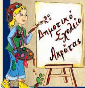
Τοπογραφία σχολείου: Αναστασία Κασιάδη